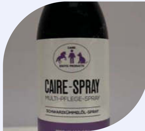
Schwarzkümmelöl aus original ägyptischen Schwarzkümmelsamen, verarbeitet in den Niederlanden