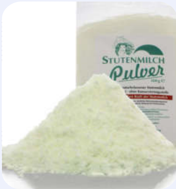
Stutenmilch aus Deutschland, der Firma Stutenmilch- Produkte Haflingerhof