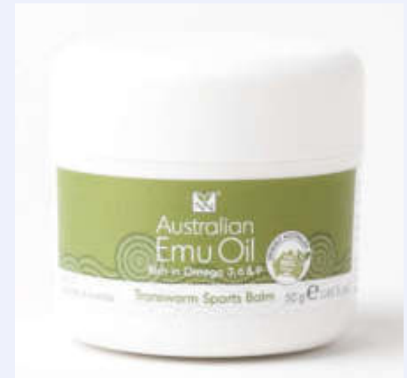
Emu-Öl hergestellt und verarbeitet in Australien, der Firma Y Not Natural (YNN)